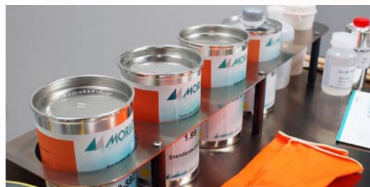
Rack pour les encres et les aditifs auxiliaires

Optimisé pour les utilisateurs de machine d'impression, le nouveau MW700 2.0 est équipé d'étagères pour stocker les produits auxiliaires, tampons, des outils et plus encore. Pour les travaux de nettoyage, un support de serviette de papier est également intégré.